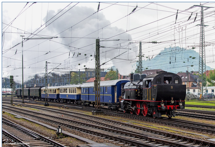
Dampflok-Eb 3/5 Nr. 9 vom DVZO