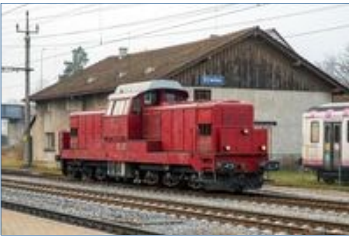
Diesellok Bm 6/6 18511 vom VRLS