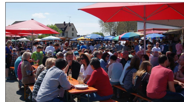
Stimmungsbild Bahnhoffest Rielasingen 2019

Ticketvorverkauf in der Bücherstube Rielasingen.